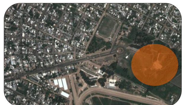
Área de intervención