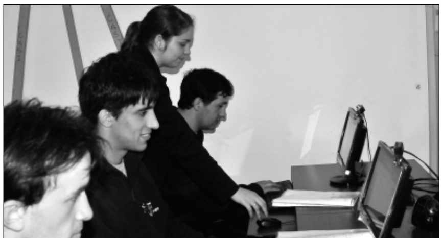
Interesante movimiento en los Espacios de Inclusión Digital

Comentó que hay también cursos básicos para adultos, que al respecto se proyectan talleres para tablets e internet, pero aclarando que en torno a idiomas solo está dictando para favorecer la inserción labo-